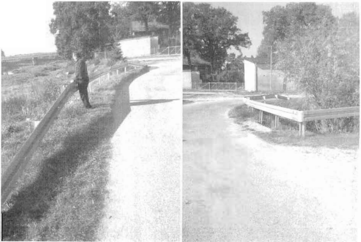
Zdjęcie nr 3 – Bariery ochronne.

Jakość pozostałych prac polegających na odbudowie przepustów i montażu barier ochronnych kontrolujący oceniają jako dobrą, co przedstawiają poniższe zdjęcia: