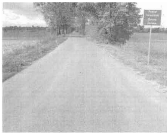
Droga powiatowa 4192P Kretków-Chwałów