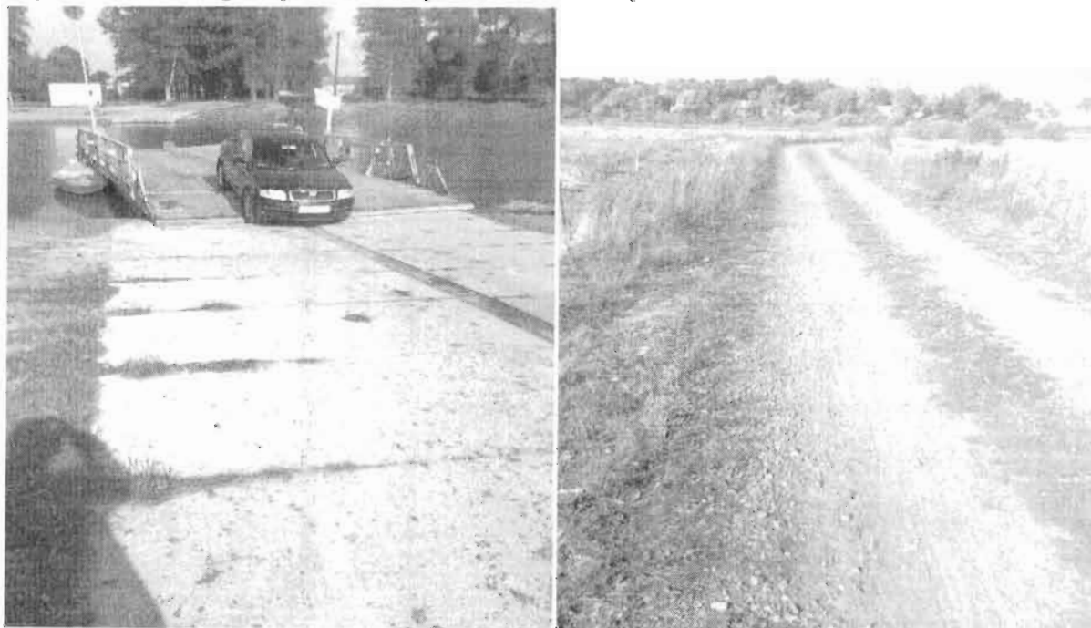
Zdjęcia nr 1 – Droga dojazdowa do promu we wsi Ciążen.

Jakość prac polegających na odbudowie dojazdów do promu i nawierzchni dróg gminnych kontrolujący ocenia jako dobrą, co przedstawiają poniższe zdjęcia: