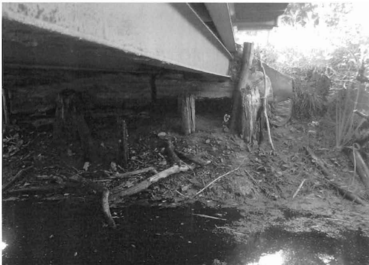
Zdjęcia nr 1 – Remont mostu rolniczego.