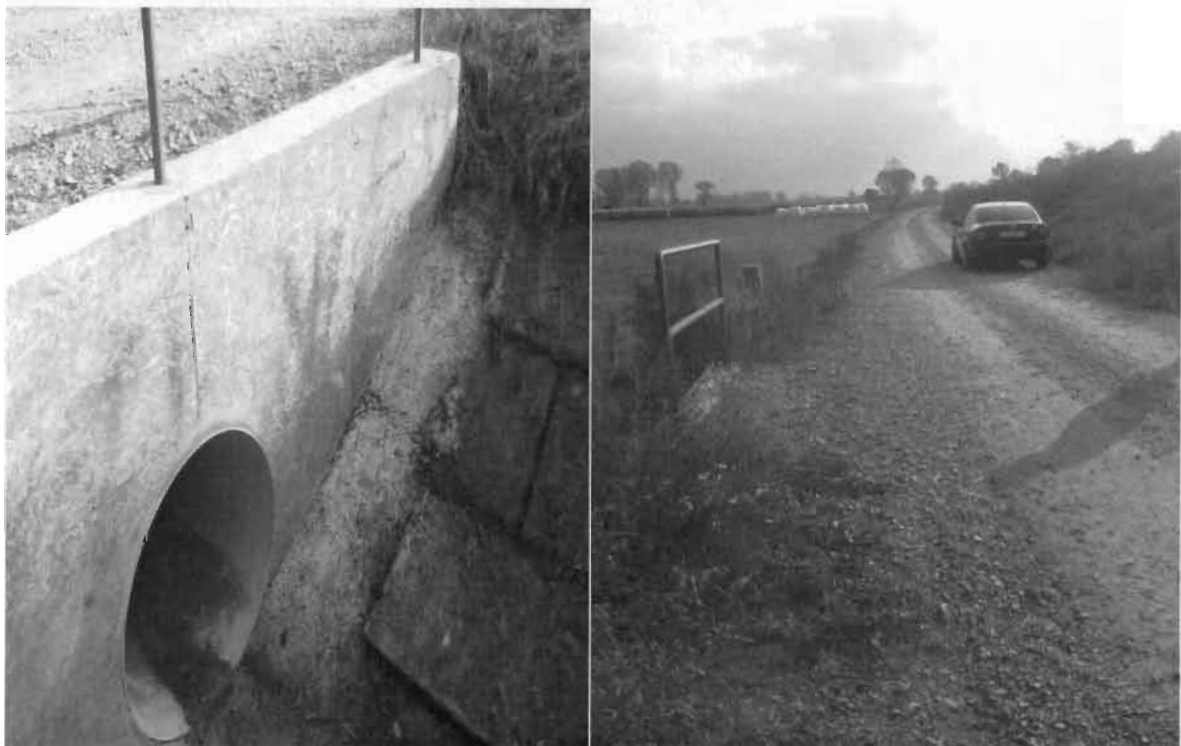
Zdjęcia nr 5 – Przepust i droga Ruda Komorska – Lisewo.

Jakość pozostałych prac polegających na odbudowie przepustu i pozostałych dróg gminnych kontrolujący oceniają jako dobrą, co przedstawiają poniższe zdjęcia: