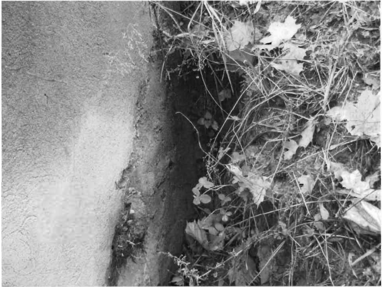
Zdjęcia nr 4 – Widoczne pęknięcia ścian czołowych.