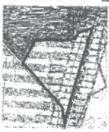
graniczka opracowania planu

Wyrzys ze Studium uwarunkowań i kierunków zagospodarowania przestrzennego gminy Budzylń zawierającego uchwałę nr 700/09 Rady Gminy Budzylń z dnia 9 listopada 1999 r.