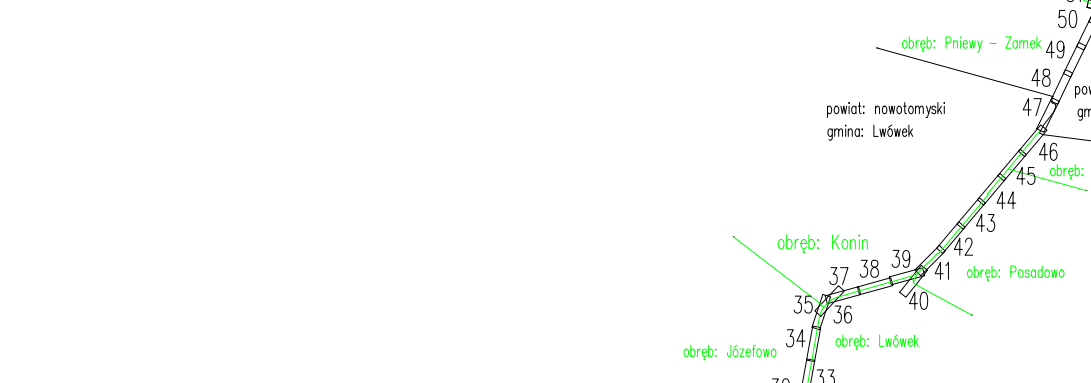
Szkieł przegładowy arkuszy map Ark 28/52

Nie wyklucza się istnienia w terenie sieci uzbrojenia terenu nie ujawnionych na mapie. Mapę sporządzono bez ustalen obciążen służebności gruntowych.