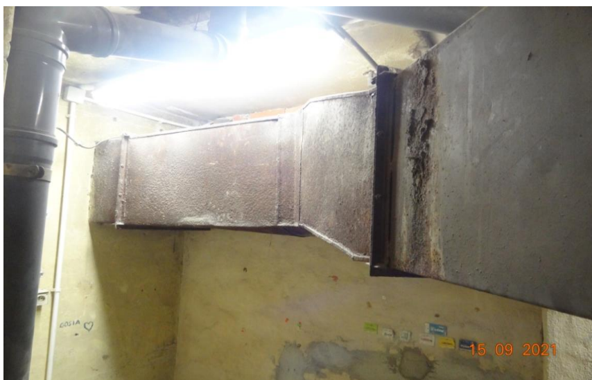
Kanał w pomieszczeniu na poziomie -I